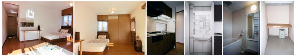
※ モデルルーム内の家具及び備品類は、賃貸の対象に含まれません。

<注記1> 面積は、壁芯計算により表示してあります。The area is calculated by the wall centre base. <注記2> ( )内のTは坪を、Jは畳を各々表しています。なお、1J当たり1.62m 2 で換算してあります。"I" and "J" in ( ) are Japanese old-fashioned units of area. <注記3> 収納スペース(床下収納1階のみ) 冷暖房 洗濯機及び冷蔵庫スペース Capboards and storage(Underfloor; 1st floor only) Air conditioner Space for washing machine and refrigerator ① 電気コンセント Power point ② TVコンセント TV point ③ 電話コンセント Telephone point ④ モニター付住宅情報機 Intercom station