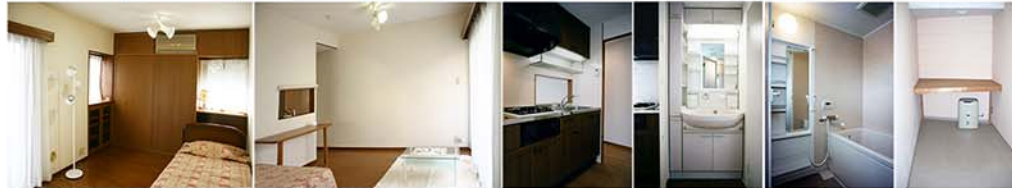
※ 室内写真の家具及び備品類はイメージです。賃貸の対象に含まれません。

<注記1> 面積は、壁芯計算により表示してあります。The area is calculated by the wall centre base. <注記2> ( )内のTは坪を、Jは畳を各々表しています。なお、1J当たり1.62m 2 で換算してあります。"I" and "J" in ( ) are Japanese old-fashioned units of area. <注記3> 収納スペース(床下収納1層のみ) 洗濯機及び冷蔵庫スペース 洗面機及び冷蔵庫スペース Capboards and storage (Underfloor; 1st floor only) Air conditioner Space for washing machine and refrigerator 電気コンセント Power point TVコンセント TV point 電話コンセント Telephone point モニター付き空室設置 Intercom station